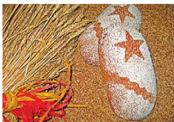
Pains du village.

Le commerce jurassien bernois propose à sa clientèle sept spécialités produites à partir des céréales cultivées sur le territoire de la commune: pain